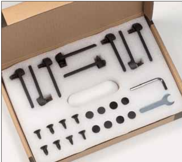
Die Füße werden nebst Werkzeug fein säuberlich in einem Karton dargeboten. Auch das ist in diesem Preissegment eher die Ausnahme

mühen als viele seiner Leidensgenossen, da er das Zepter bereits bei 14 Kilohertz an einen Bändchen-Superhochöner übergibt, der bis 30 Kilohertz spielt. Dieses Hochton-Doppel weicht deutlich von allem ab, was man von den Mitbewerbern in dieser Klasse gewohnt ist, stellt bei Dali aber keine größere Besonderheit dar. Praktisch jeder Lautsprecher der Dänen verfügt über das sehr hoch auflösende und dennoch geschmeidig klingende Tweeter-Array.